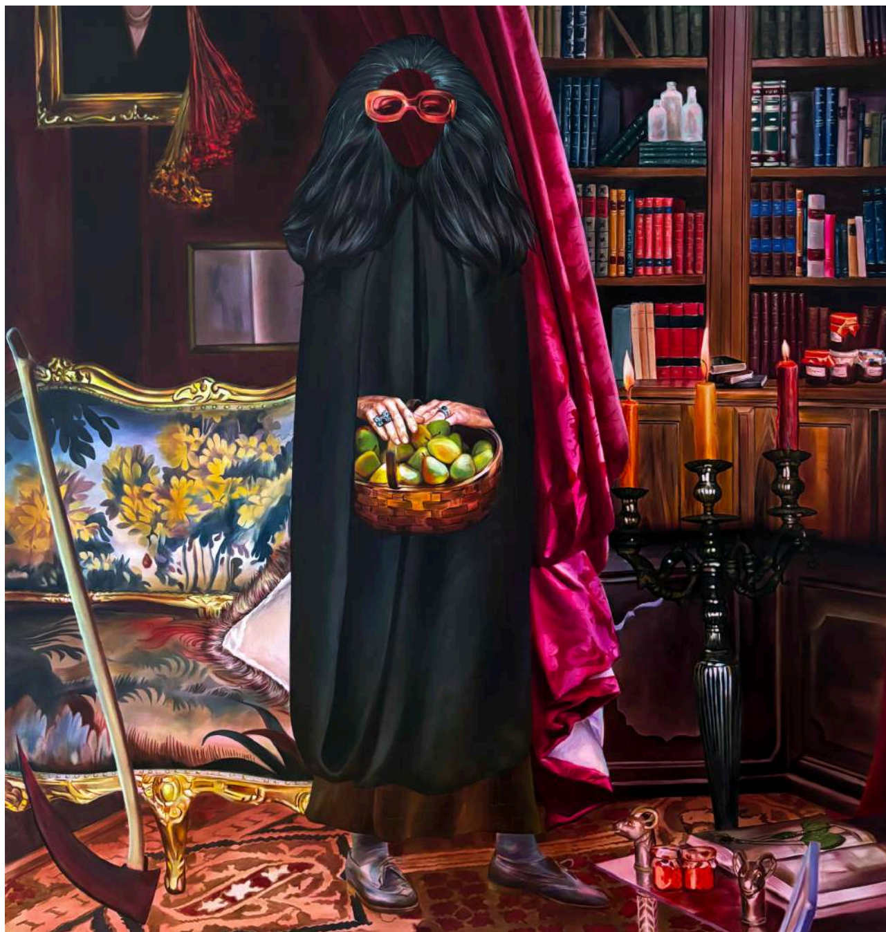
Martyna Borowiecka Morticia. Żyjąc w antracycie, 2025 180 x 170 cm olej na płótnie