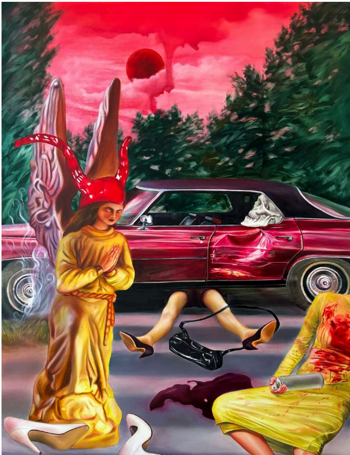
Martyna Borowiecka Ze śmiercią jej do twarzy, 2025 170 x 130 cm olej na płótnie