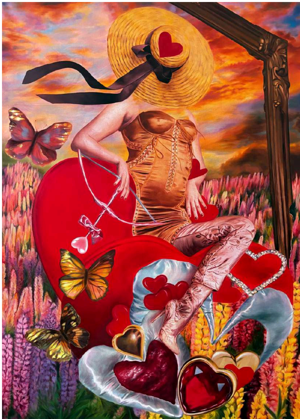
Martyna Borowiecka Walentyna, 2024 170 x 120 cm olej na płótnie