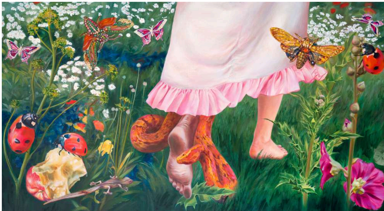
Martyna Borowiecka Ostatni taniec Eurydyki, 2025 85 x 160 cm olej na płótnie