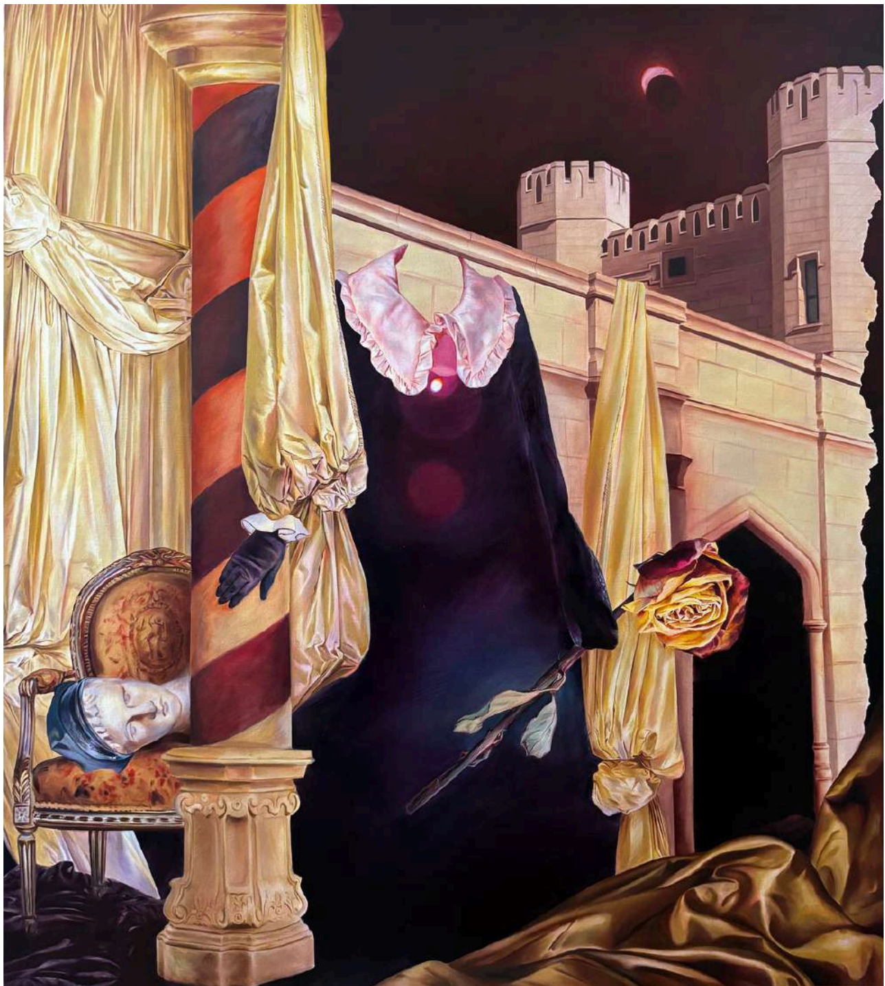
Martyna Borowiecka Taki pejzaż Ewy, 2024 180 x 165 cm olej na płótnie