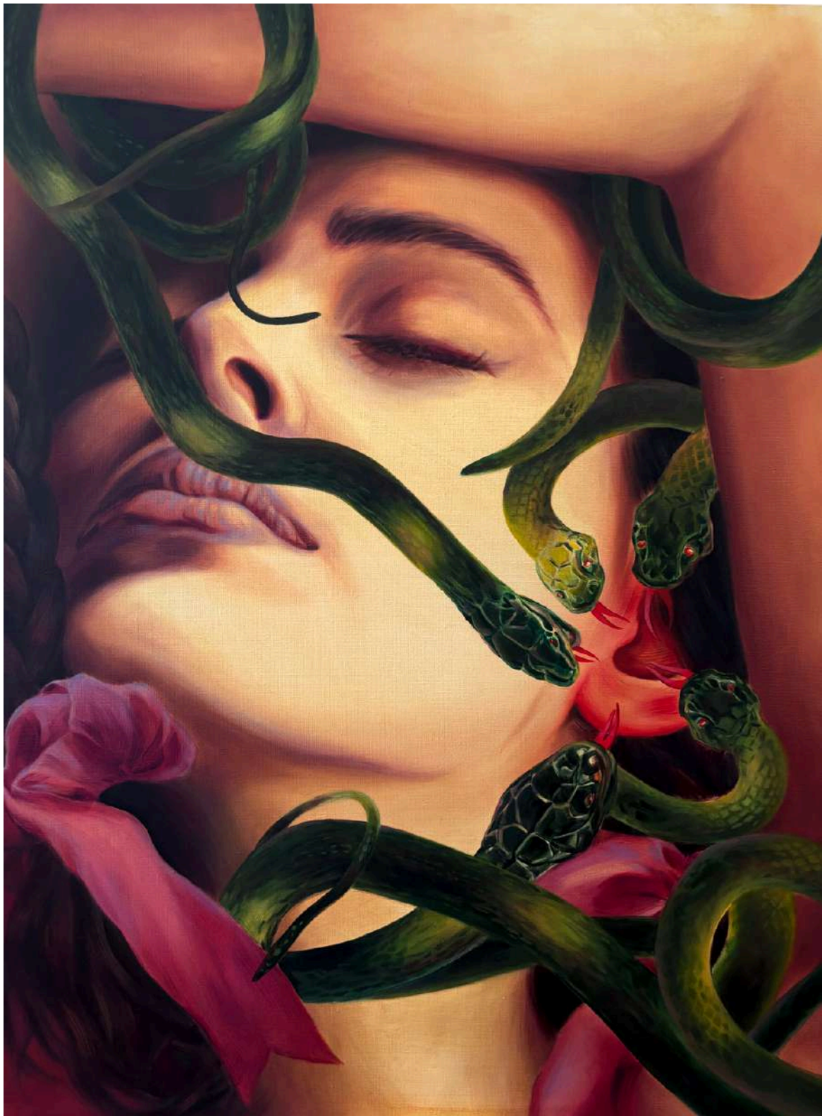
Martyna Borowiecka Kassandra, 2025 80 x 50 cm olej na płótnie