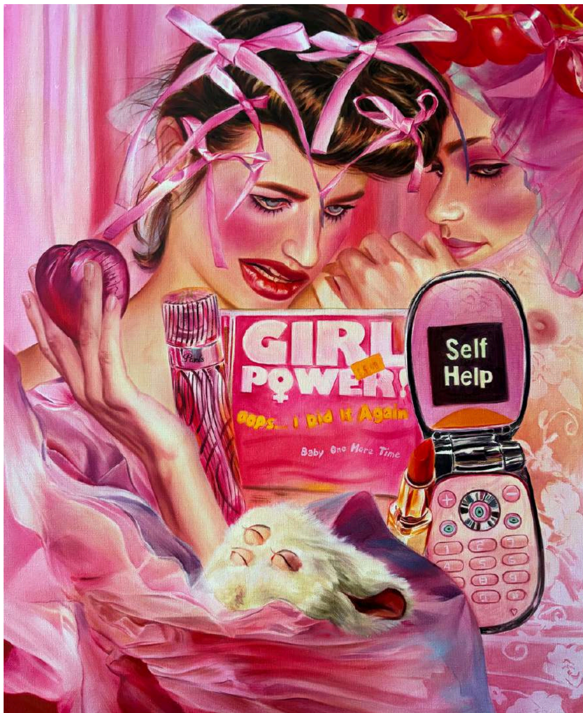
Martyna Borowiecka Tęsknota, 2024 80 x 65 cm olej na płótnie