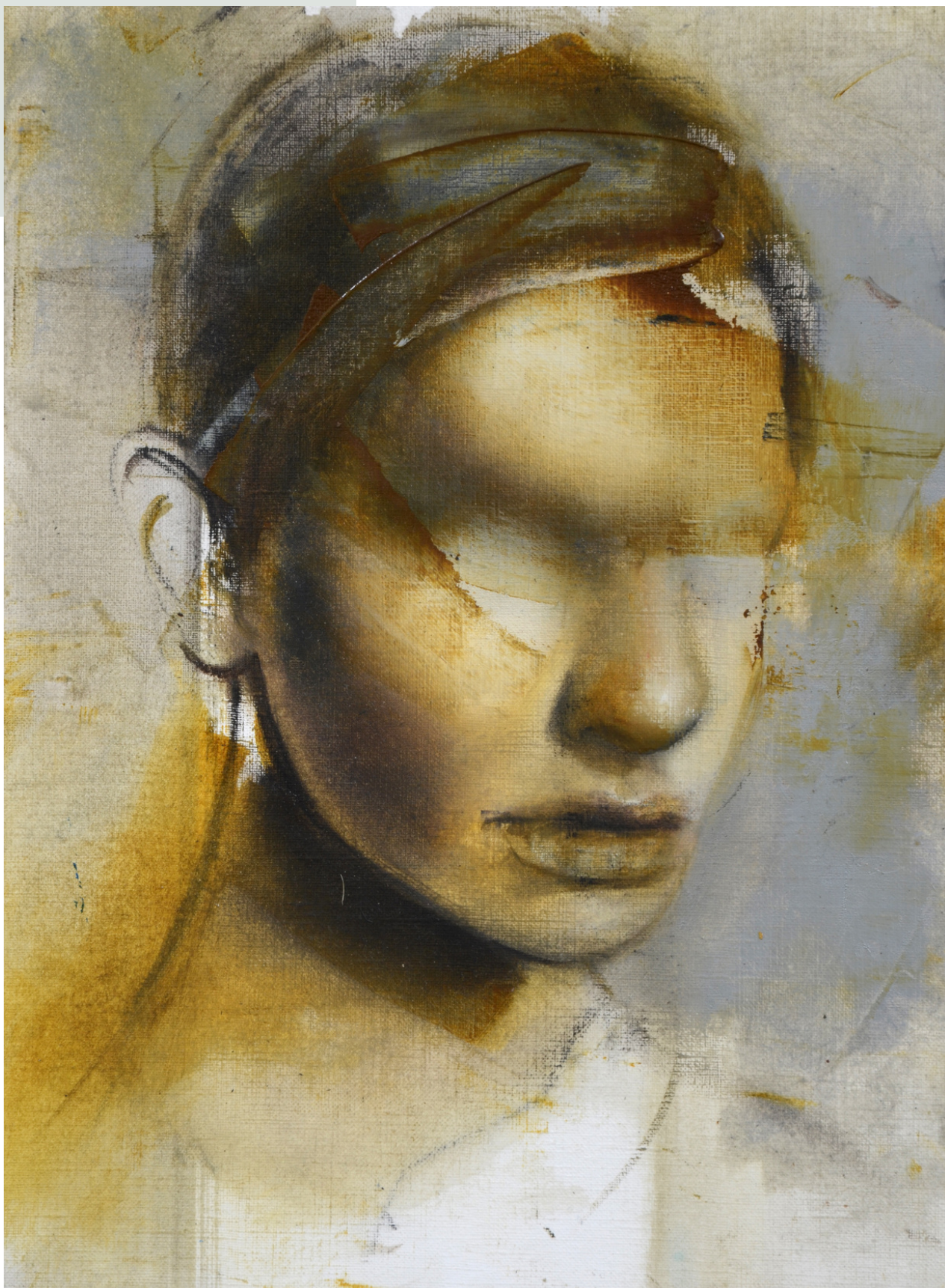
Umbra, 2022 r. olej, papier 32 x 24 cm