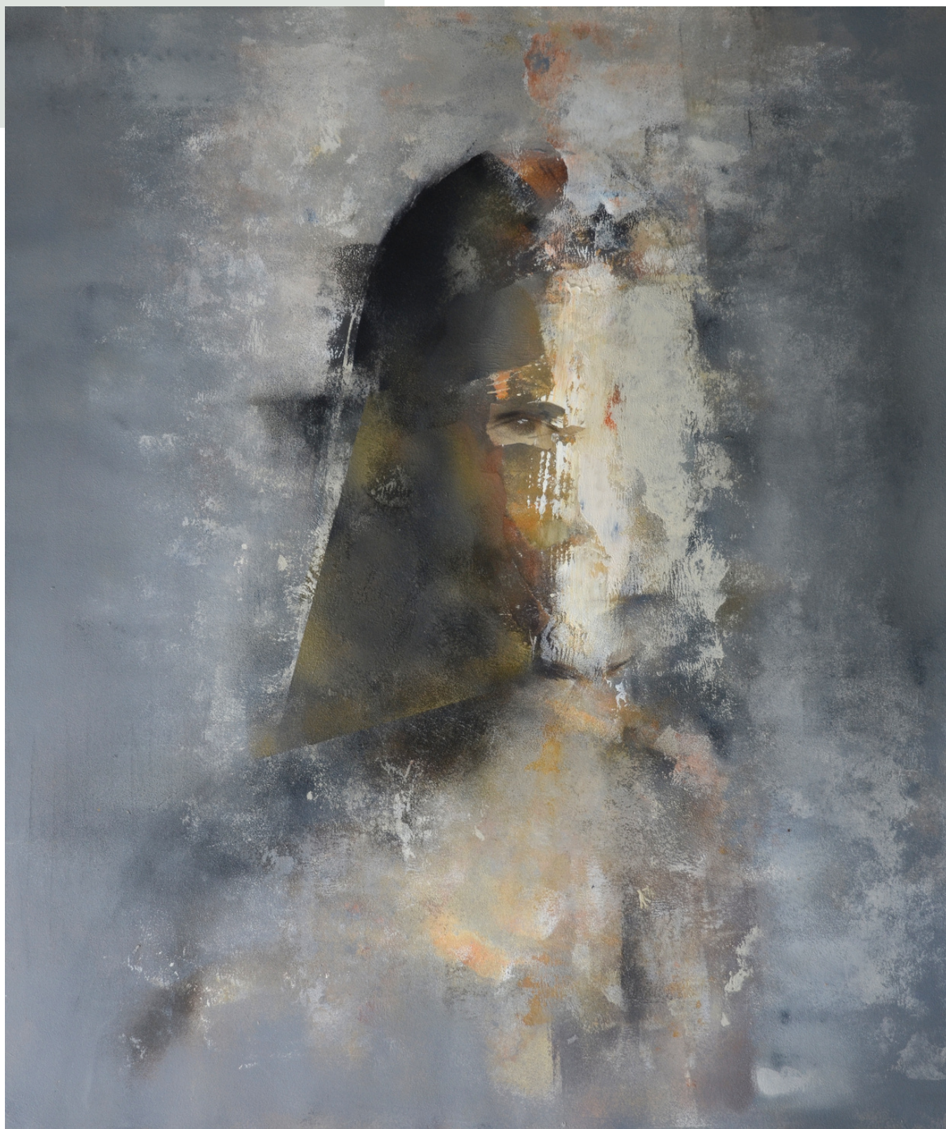
Ukryta, 2020 r. olej, płyta 58,5 x 49,5 cm