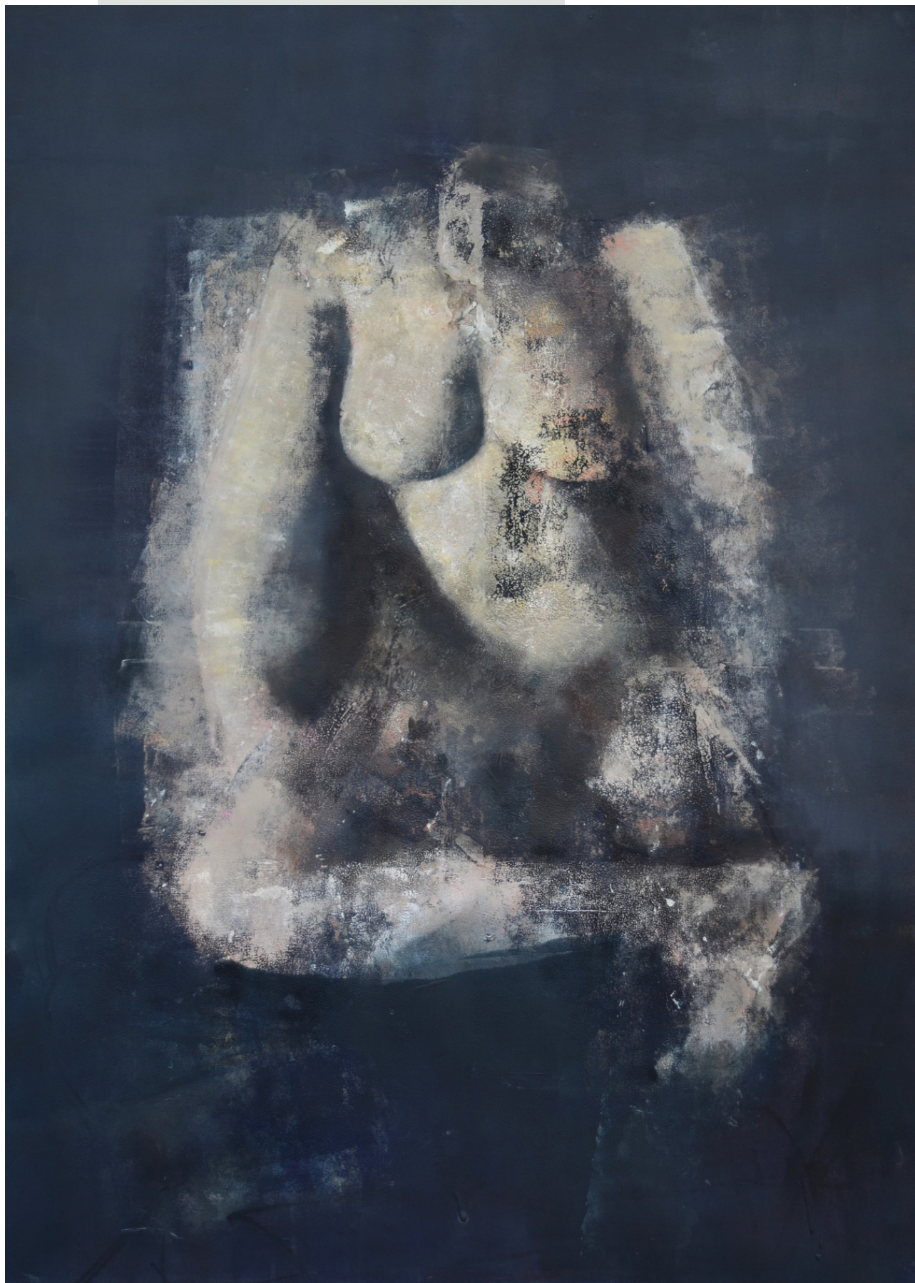
Corpo, 2020 r. olej, płótno 140 x 100 cm