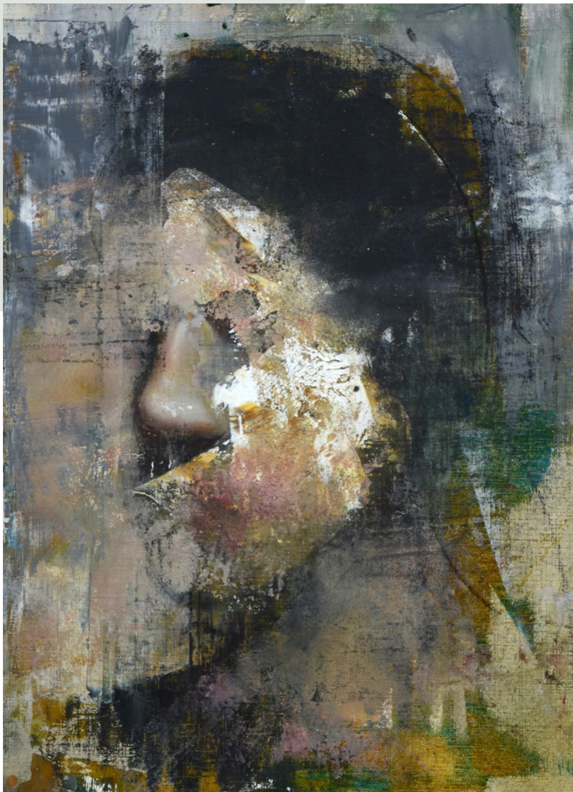
Materia, 2022 r. olej, papier 33 x 24 cm