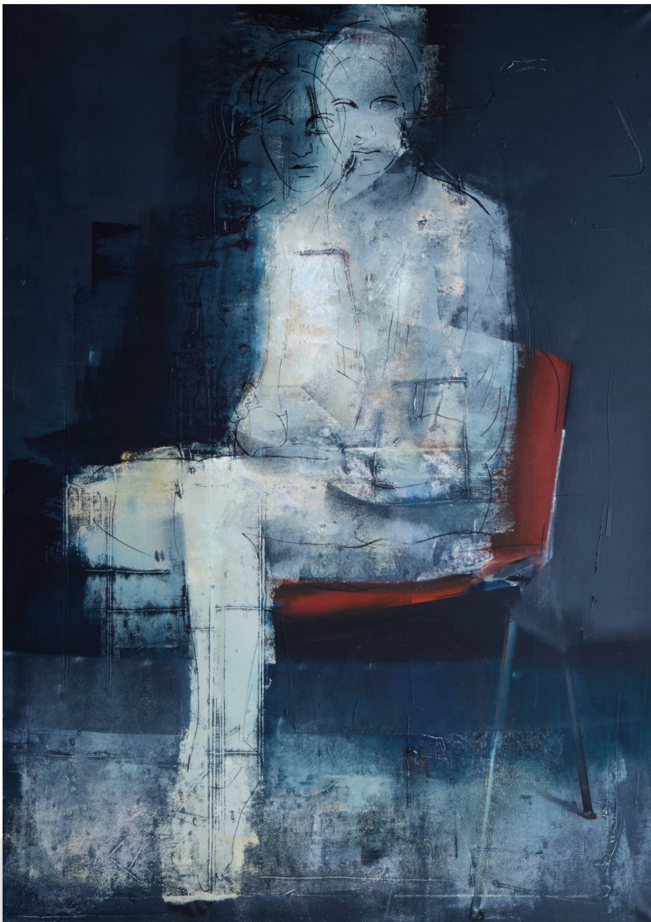
Czerwone krzesło, 2018 r. olej, płótno 140 x 100 cm