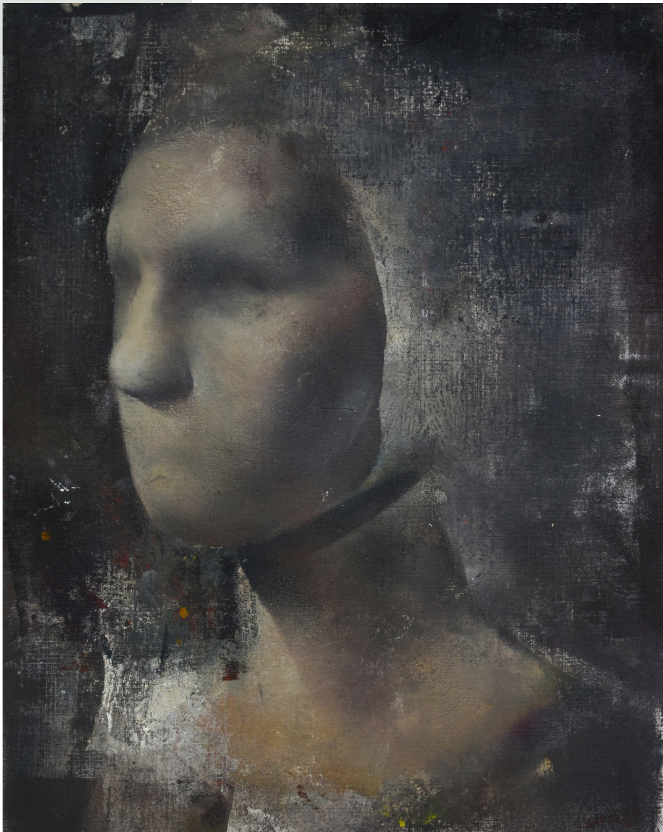
Bezustny, 2022 r. olej, papier 41 x 33 cm