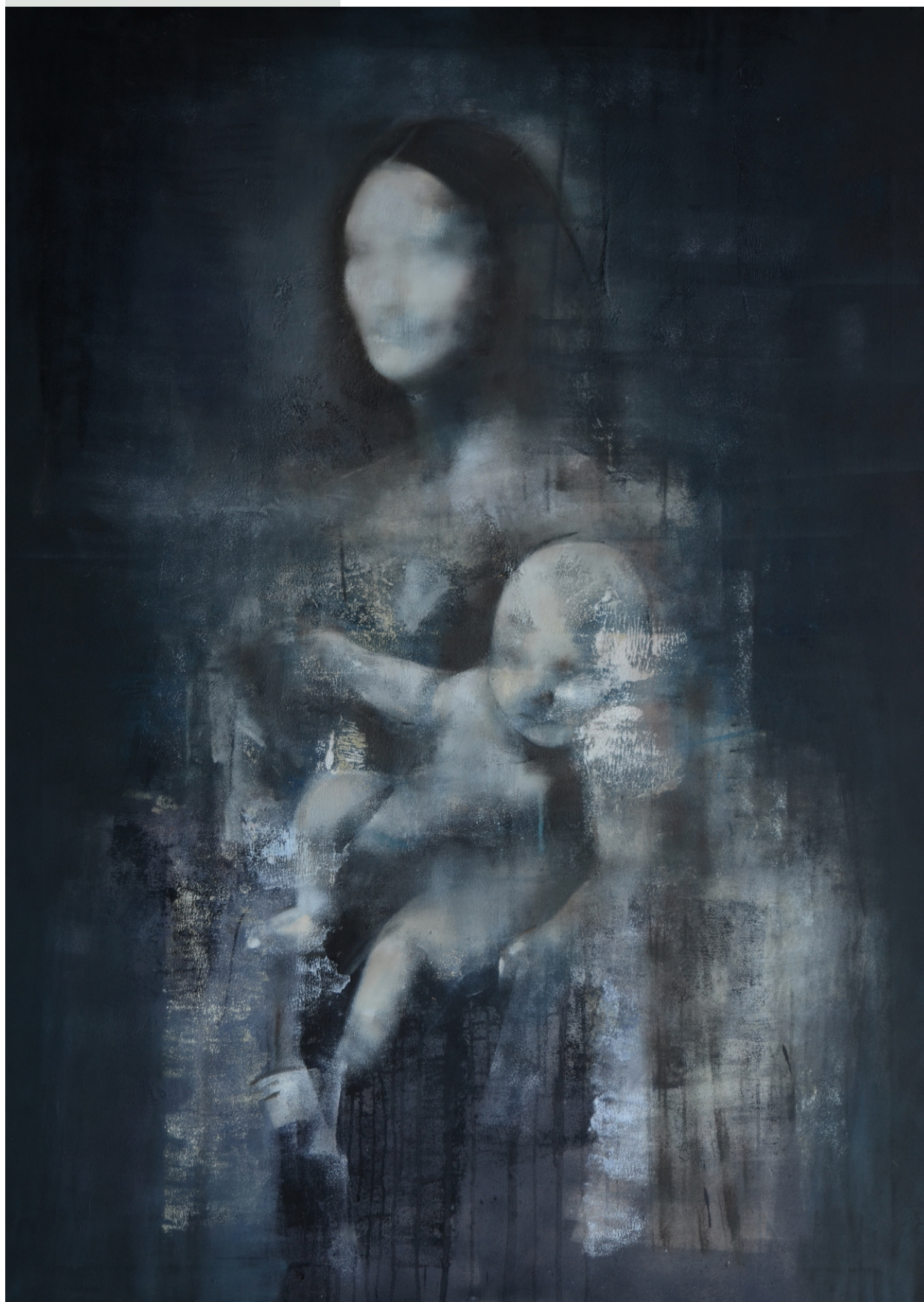
Mona II, 2019 r. olej, płótno 140 x 100 cm