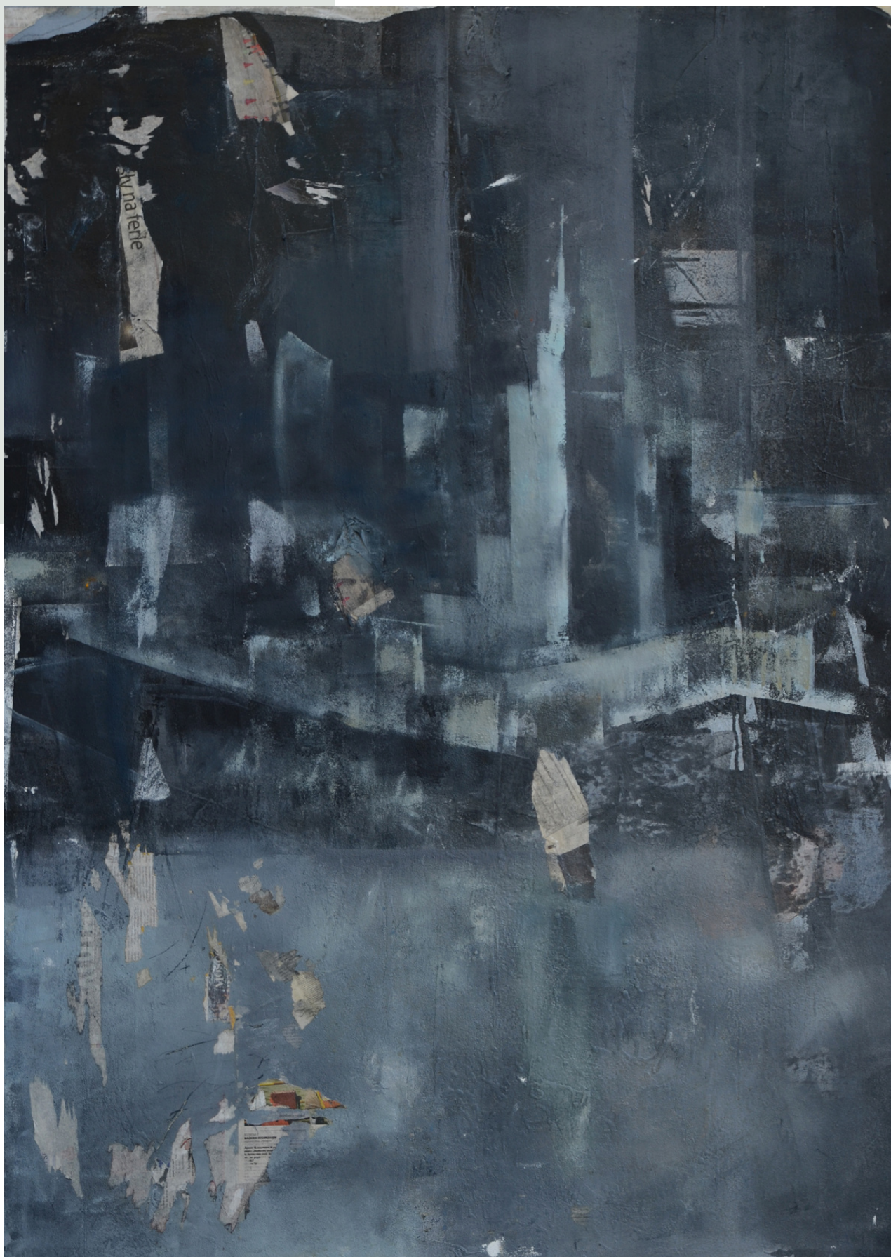
Warszawa, 2017 r. olej, płótno 150,5 x 107,5 cm