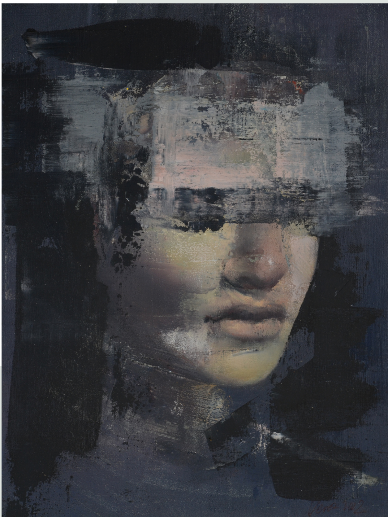
Zamęt, 2022 r. olej, papier 34 x 25 cm