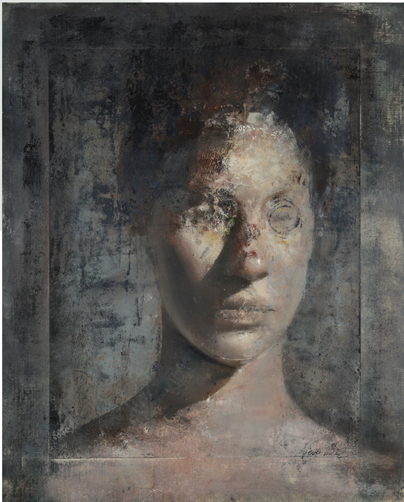
Empiria, 2022 r. olej, papier 41 x 33 cm