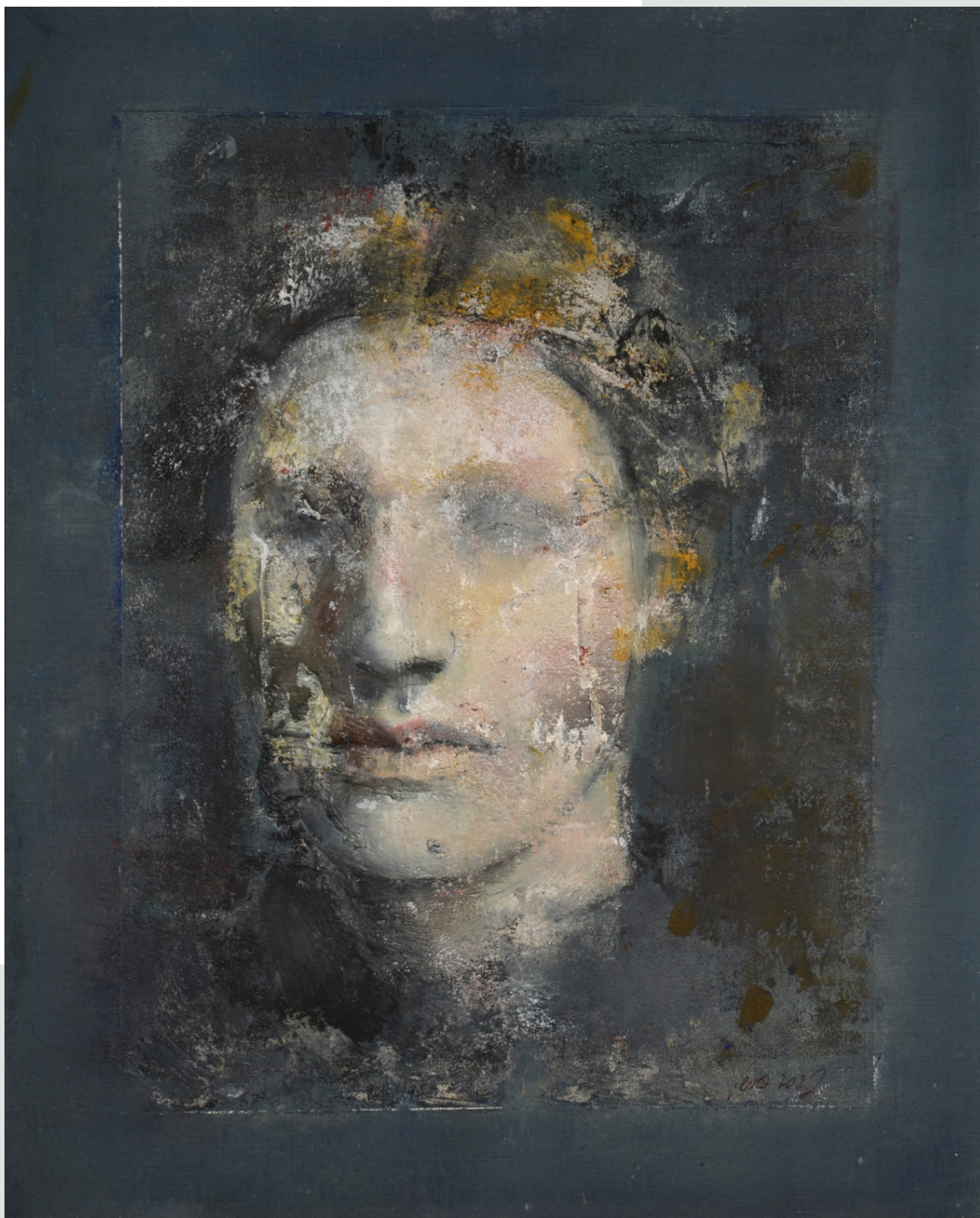
Andros, 2022 r. olej, papier 41 x 33 cm