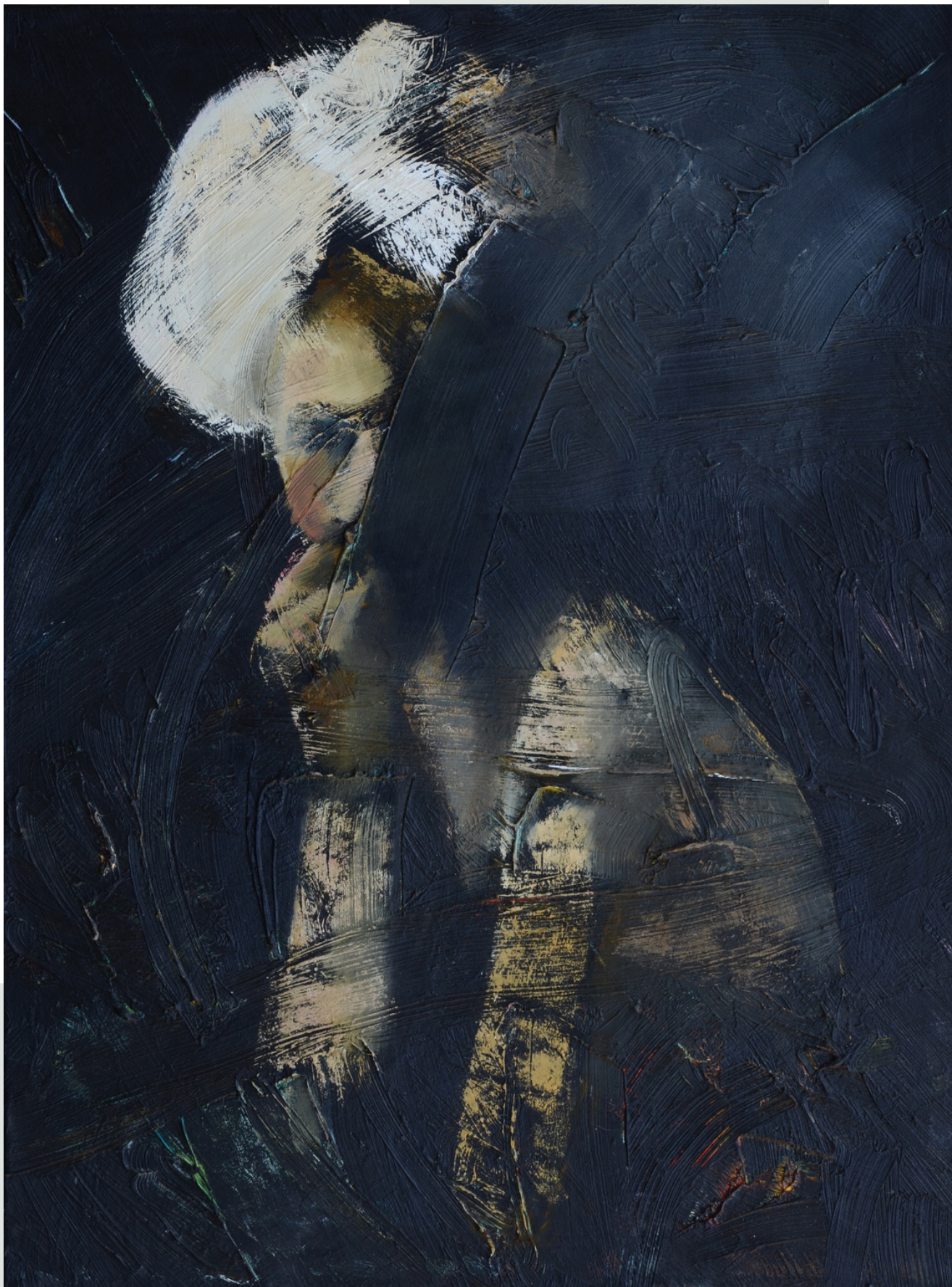
Półmrok, 2016 r. olej, płótno 80 x 60 cm