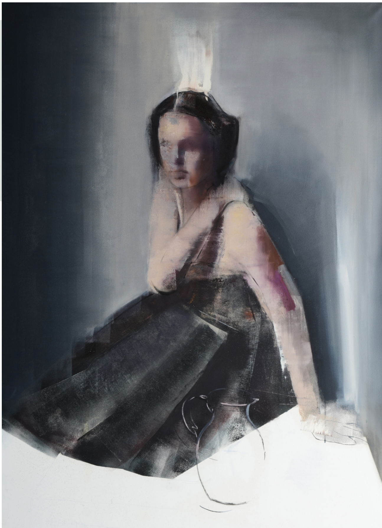
Ona, 2018 r. olej, płótno 140 x 100 cm